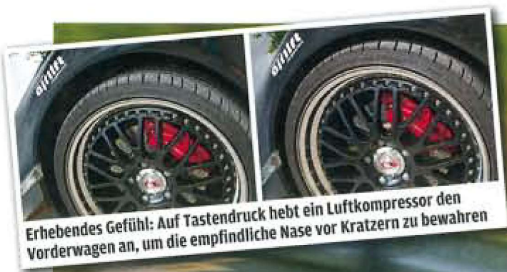
Erhebendes Gefühl: Auf Tastendruck hebt ein Luftkompressor den Vorderwagen an, um die empfindliche Nase vor Kratzern zu bewahren